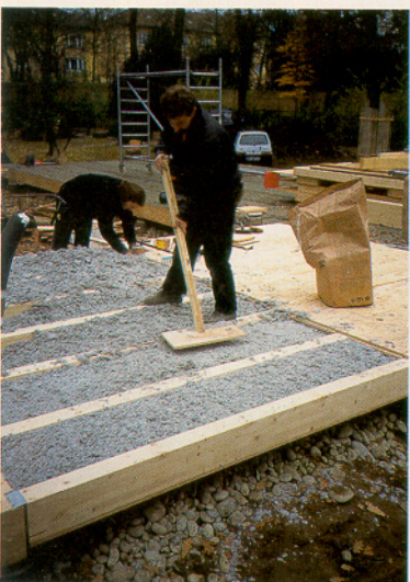
Einbringen der ISOFLOC-Dämmung in die Bodenelemente

plankung gehängt. Um die Luftdichtigkeit zu gewährleisten, wurde an den Längsträgern eine Leiste mit einem vorkomprimierten Dichtungsband angebracht. In die Gefache dieser Elemente wurde eine ISOFLOC-Dämmung eingebracht. Nachdem die Bodenplatte fertiggestellt und mit einer Schicht aus Bitumenschweißbahnen abgedichtet war, konnte mit der Montage der Wandelemente begonnen werden.