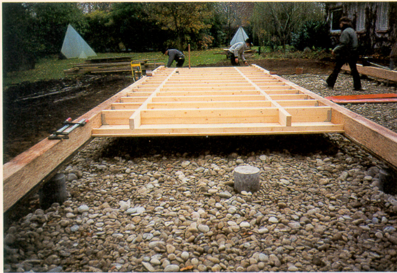
Bodenelemente „schwebend“ über dem bekiesteten Untergrund

werden konnte. Die beidseitige Beplankung wurde daher auch zur Aufnahme des Sekundärmomentes im Bereich der Öffnung herangezogen.