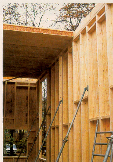
Holzrahmenwände in 5,50 m Bauhöhe