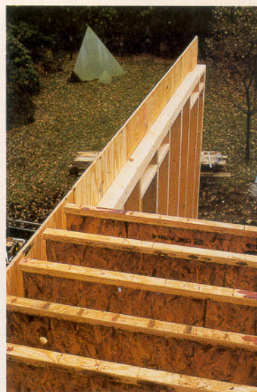
TGJ-Träger in den Dachelementen

Mittels Balkenschuhen und im Randbereich Balken-Z-Profilen (Bozett) wurden zwischen die Längsträger vorgefertigte Bodenelemente aus KVH mit BFU-Be-