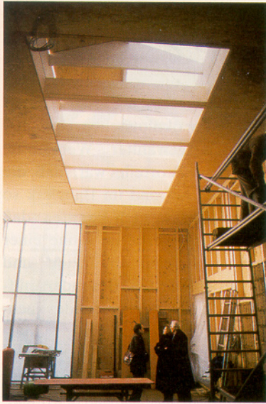
Atelierraum mit Oberlicht