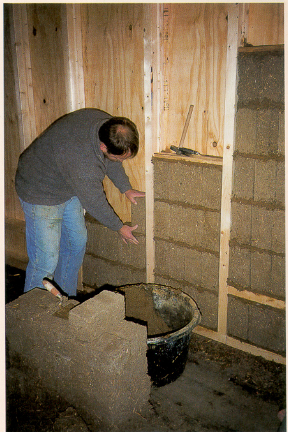
Ausmauerung der Gefache mit Leichtlehmsteinen