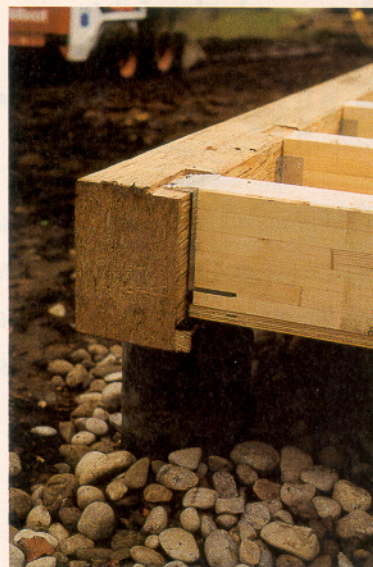
Lagerung der Bodenelemente mit Bozett-Winkeln

tiven und außergewöhnlichen Charakter geben. Die konsequente Umsetzung des Konzeptes führte zur Verwendung von technisch getrocknetem Konstruktionsvollholz mit einer Ausmauerung aus Leichtlehmsteinen. Die Beachtung des konstruktiven Holzschutzes in allen Details erlaubte den Verzicht auf chemischen Holzschutz. Die Dämmung besteht in Dach- und Bodenelementen aus Zellulosefasern (ISO-FLOC). Die Wände des Ateliergebäudes erhalten unter dem durchgefärbten Kalkputz eine zweilagige Dämmung aus Schilfrohrplatten, die Wände des Zwischenbaues unter der Douglasienverschalung eine Dämmung aus Baumwolle (ISOCOTTON).