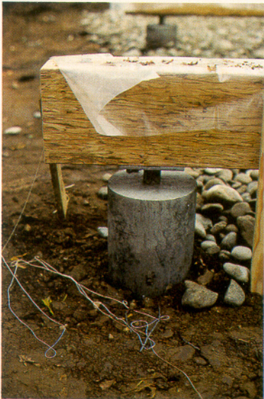
Lagerung der Parallel-Träger auf Stahldollen