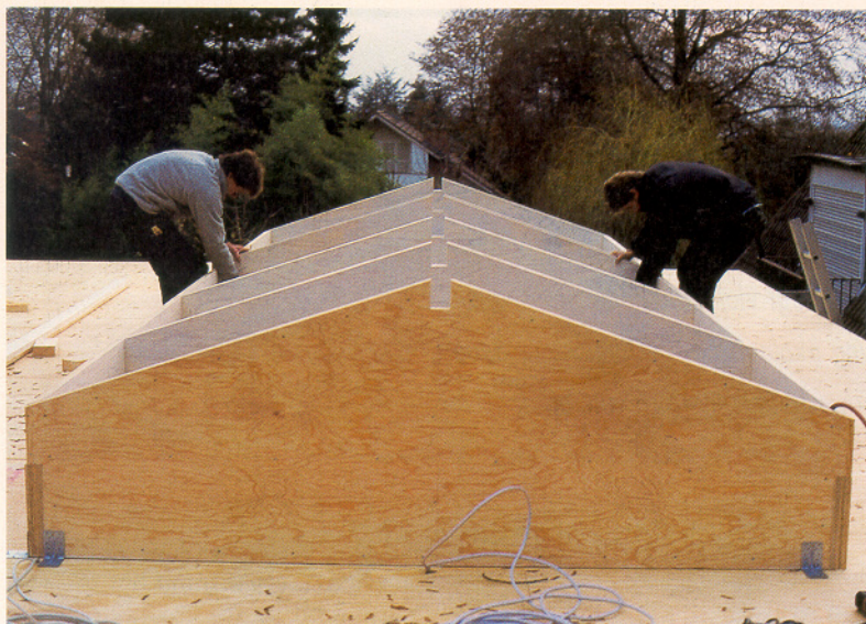
BFU-Schotten des Oberlichts