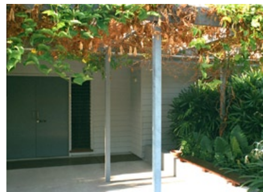
Medical Center, Townsville, Qld.

Schauer + Volhard Architekten BDA Michael Stacey Architect P/L